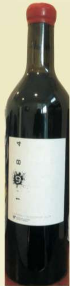
საფერავი 1984 Saperavi 1984