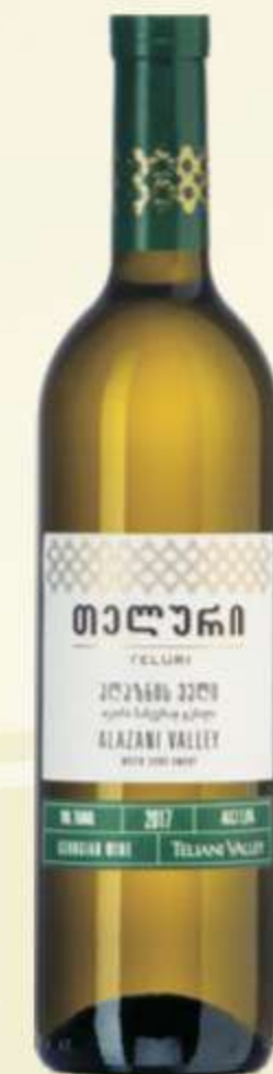
ალაზნის ველი Alazani Valley