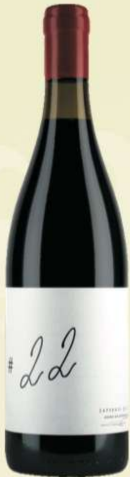
საფერავი მამა Saperavi Mama