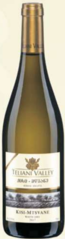
ქისი მწვანე Kisi Mtsvane