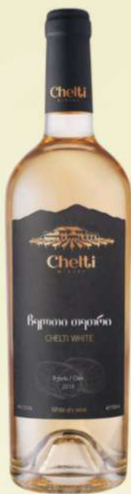
ჩელთი თეთრი Chelti white PRICE 40 ლ