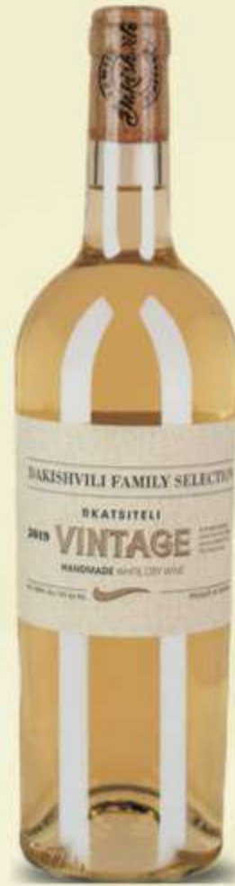
რქაწითელი ვინტაჟი Rkatsiteli Vintage