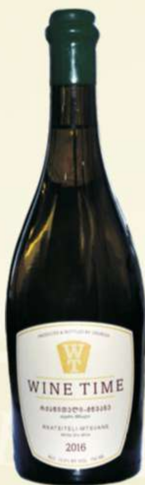
რქაწითელი მწვანე Rkatsiteli Mtsvane