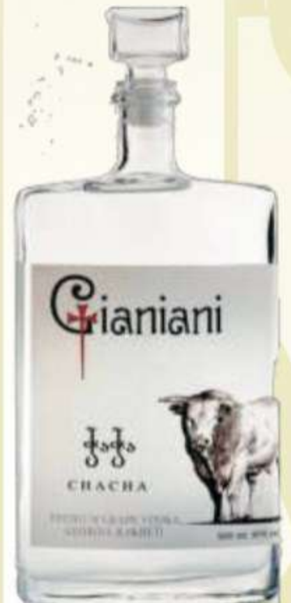
ჭაჭა კლასიკური Chacha Classic PRICE 65 ლ