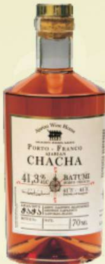
პორტო ფრანკო Porto Franco Gold