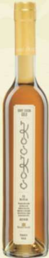
ჭაჭა ოქრო Chacha aged in oak PRICE 55 ლ 0.05 - 6 GEL