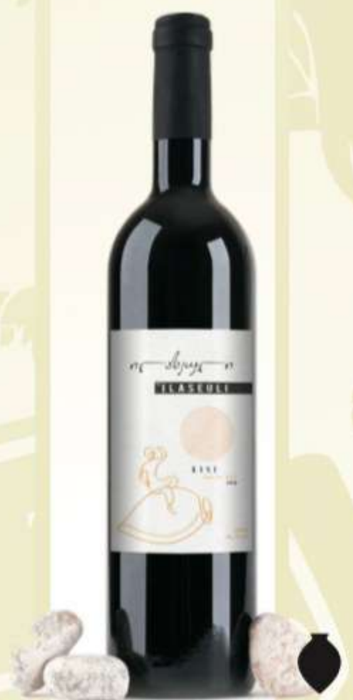
ქისი ქვევრი Kisi Qvevri