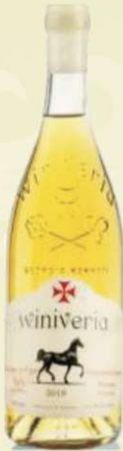
ციცქა ცოლიკაური კრახუნა Tsistka Tsolikauri Krakhuna