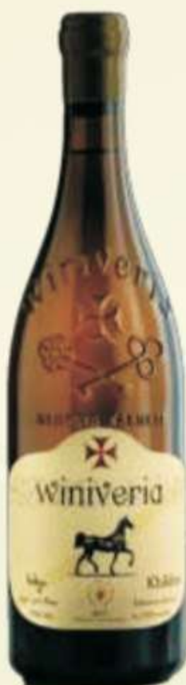
ხიხვი ქვევრი Khikhvi Qevri