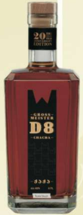
გროს მაისტერ D8 Gross Meister D8 0,700L PRICE 100 ლ 0.05 - 8 GEL