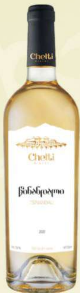
წინანდალი Tsinandali PRICE 30 ლ