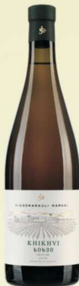
ხიხვი Kikhvi PRICE 40 ლ