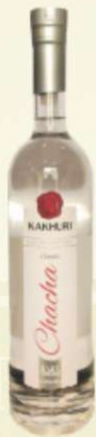
ჭაჭა კლასიკური Chacha Classic PRICE 30 ლ 0.05 - 3 GEL