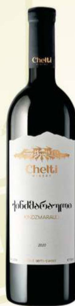
ქინძმარაული Kindzmarauli PRICE 35 ლ