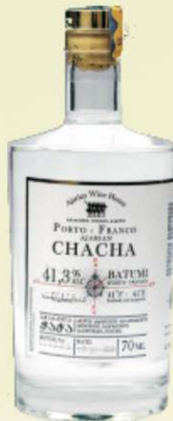
პორტო ფრანკო Porto Franco Silver