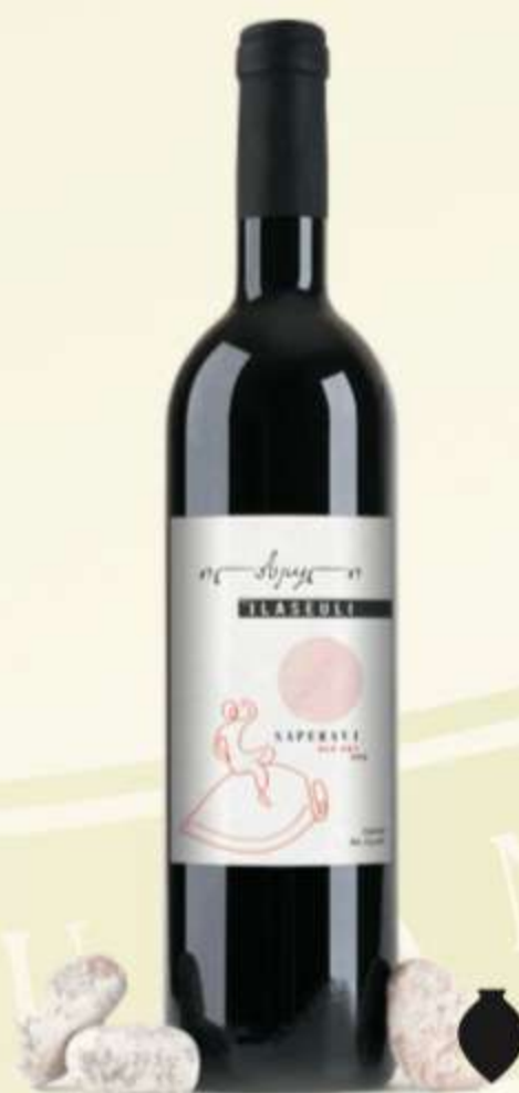
საფერავი ქვევრი Saperavi Qvevri