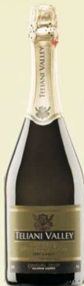
ნახევრად ტკბილი Semi sweet