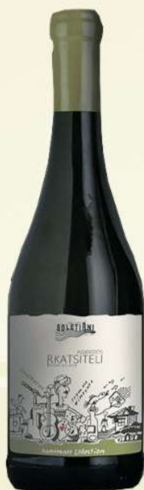
რქაწითელი გაუფილტრავი Rkatsiteli unfiltered Handmade collection