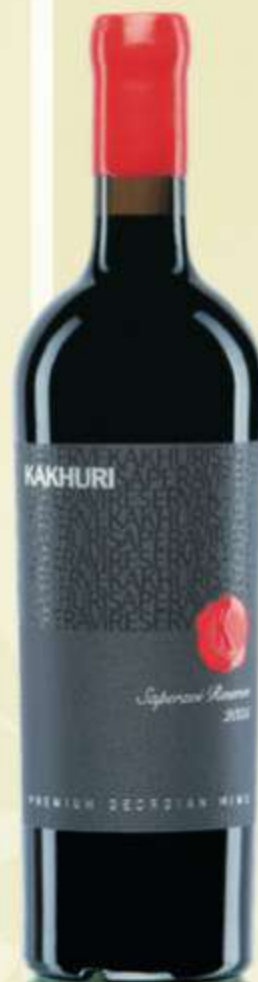
საფერავი რეზერვი 2005 Saperavi Reserve 2005