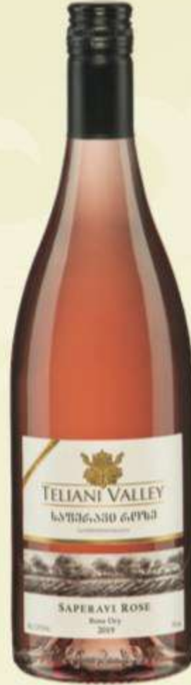
საფერავი როზე ნახევრად/მშრალი Saperavi Rose semi-dry