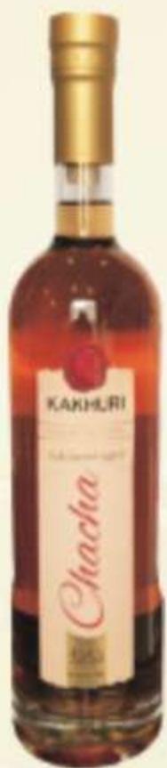
ჭაჭა მუხაში Chacha in oak PRICE 40 ლ 0.05 - 4 GEL