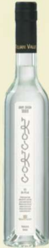
ჭაჭა ვერცხლი Chacha Silver PRICE 45 ლ 0.05 - 5 GEL