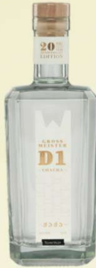
გროს მაისტერ D1 Gross Meister D1 0,700L PRICE 80 ლ