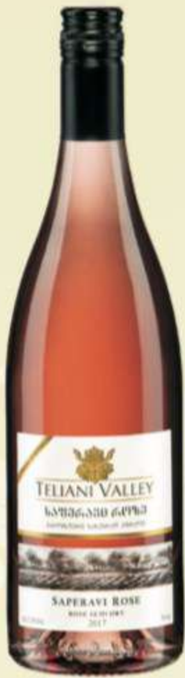
საფერავი როზე მშრალი Saperavi Rose dry