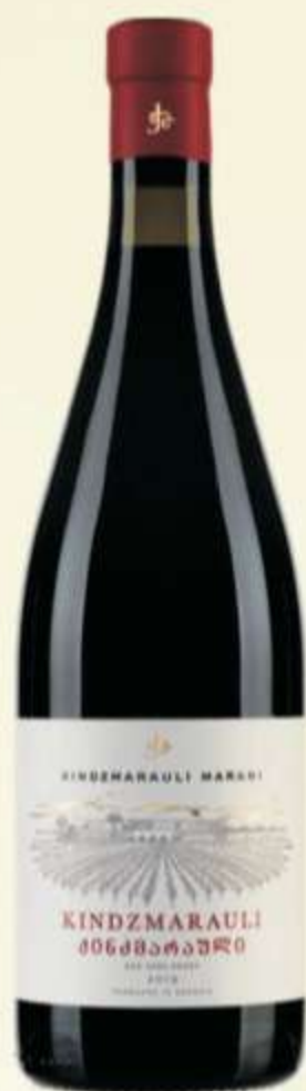
ქინძმარაული Kindzmarauli PRICE 45 ლ