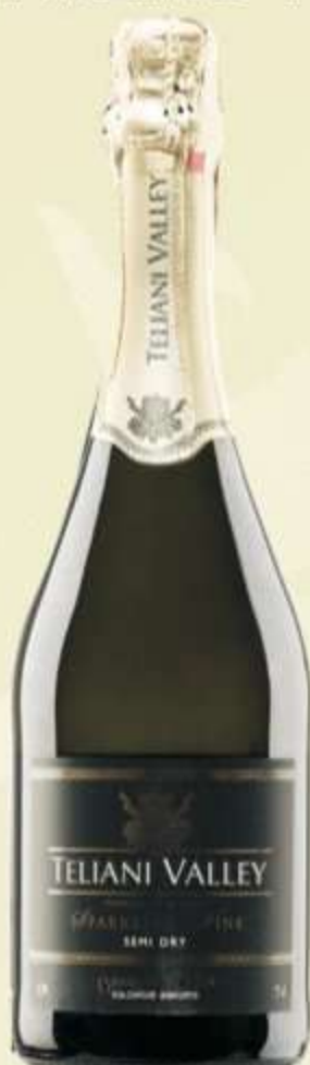
ნახევრად მშრალი Semi dry