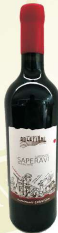
საფერავი Saperavi Handmade collection