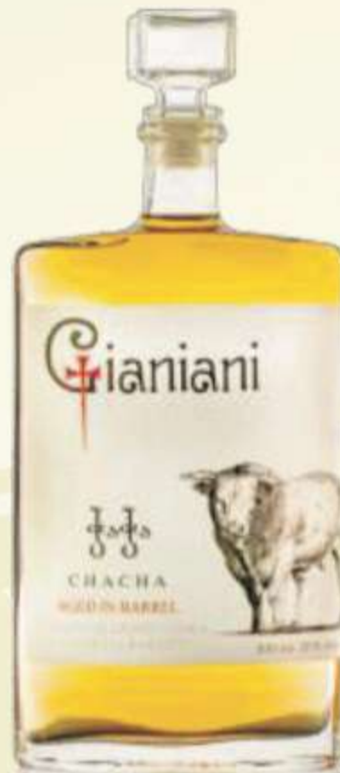
ჭაჭა მუხაში Chacha in oak PRICE 70 ლ