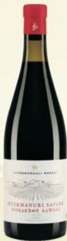
ოცხანური საფერი Otskhanuri Saperi PRICE 60 ლ