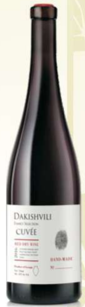
კუვე წ/შშრალი Cuvée Red dry wine