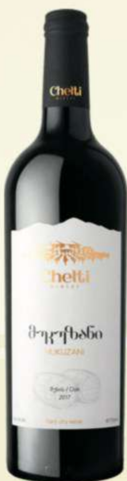
მუკუზანი Mukuzani PRICE 50 ლ