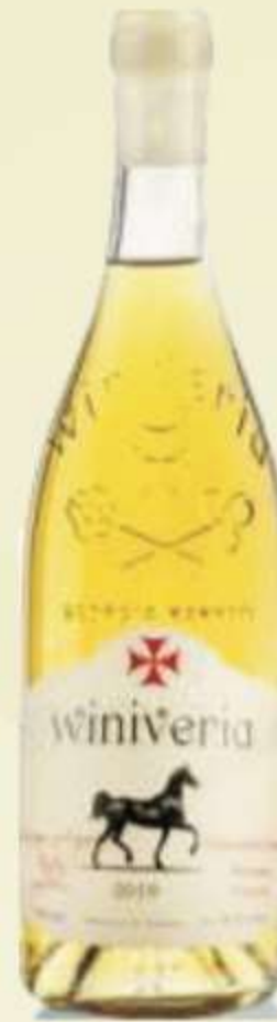
გორული მწვანე Goruli Mtsvane