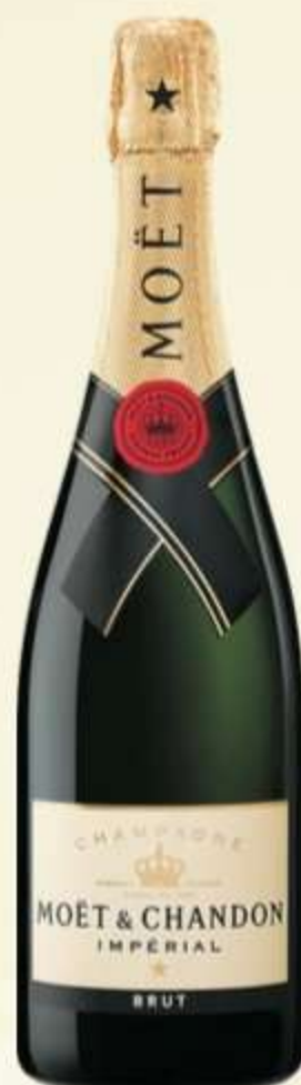
მოეტ შანდონ Moët Chandon

FONDÉ EN 1743 MOËT & CHANDON CHAMPAGNE ★