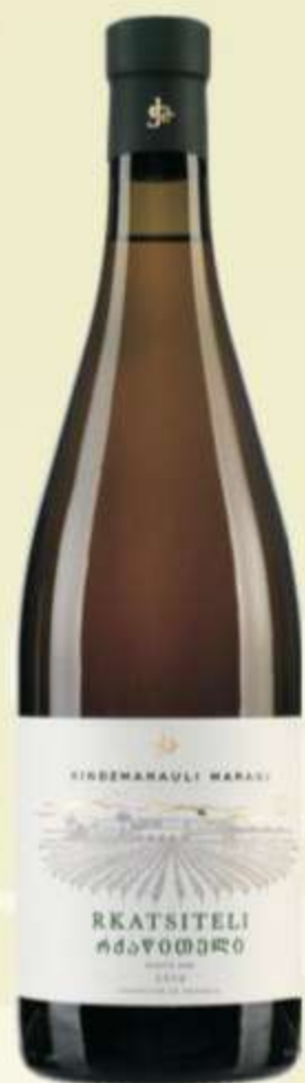
რქაწითელი Rkatsiteli PRICE 35 ლ