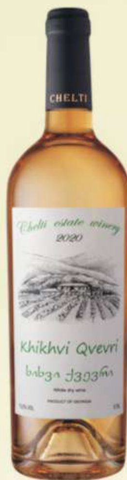
ხიხვი ქვევრი Khikhvi Qvevri PRICE 45 ლ