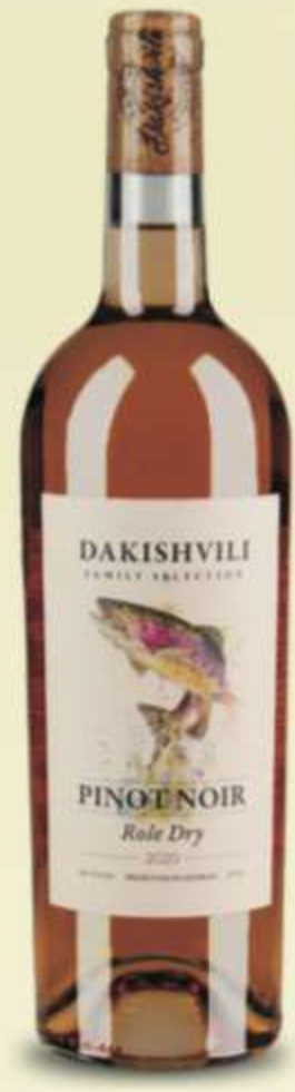
პინო ნოარ Pinot Noir ROSE DRY