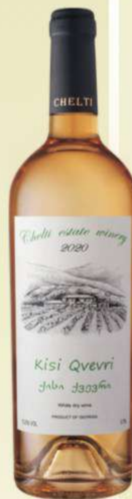
ქისი ქვევრი Kisi Qvevri PRICE 45 ლ