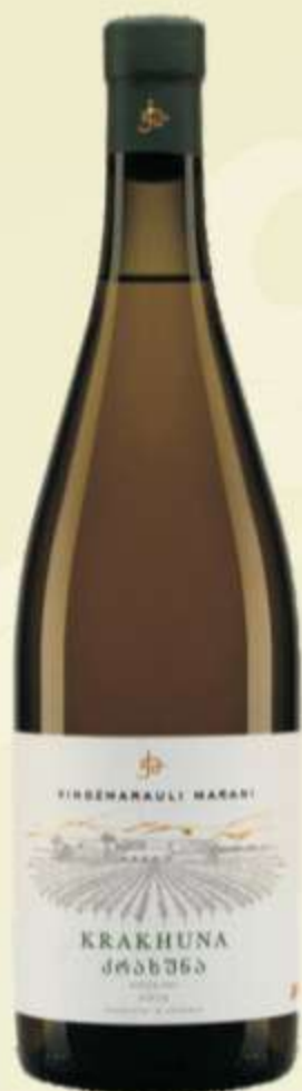
კრახუნა Krakhuna PRICE 50 ლ