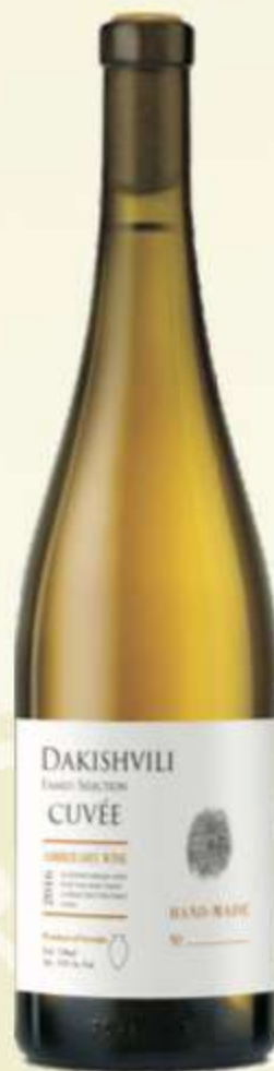
კუვე თ/შშრალი Cuvée Amber dry wine