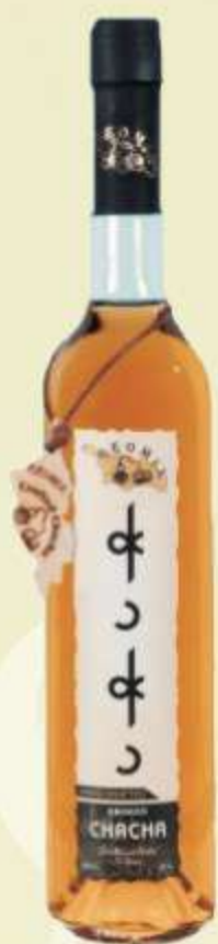
ჭაჭა შებოლილი Chacha Smoked

Adjarian Wine House აჭარული ღვინის სახლი PORTO - FRANCO