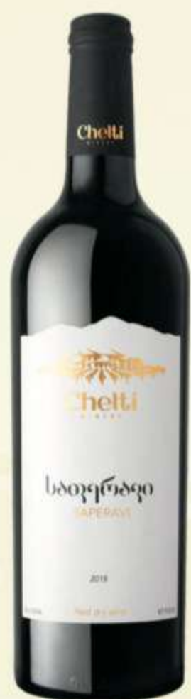
საფერავი Saperavi PRICE 35 ლ