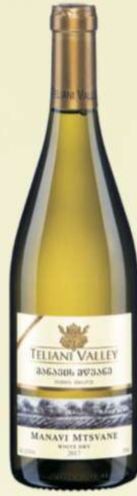
მანავის მწვანე Manavi Mtsvane