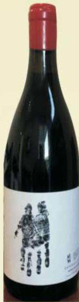
საფერავი ჩვენი Saperavi We Me