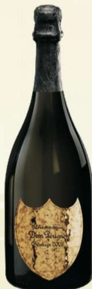
დომ პერინიონი Dom Perignon