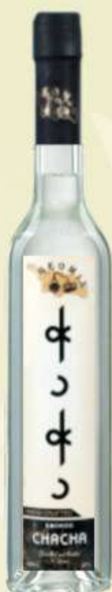
ჭაჭა ტრადიციული Chacha Traditional